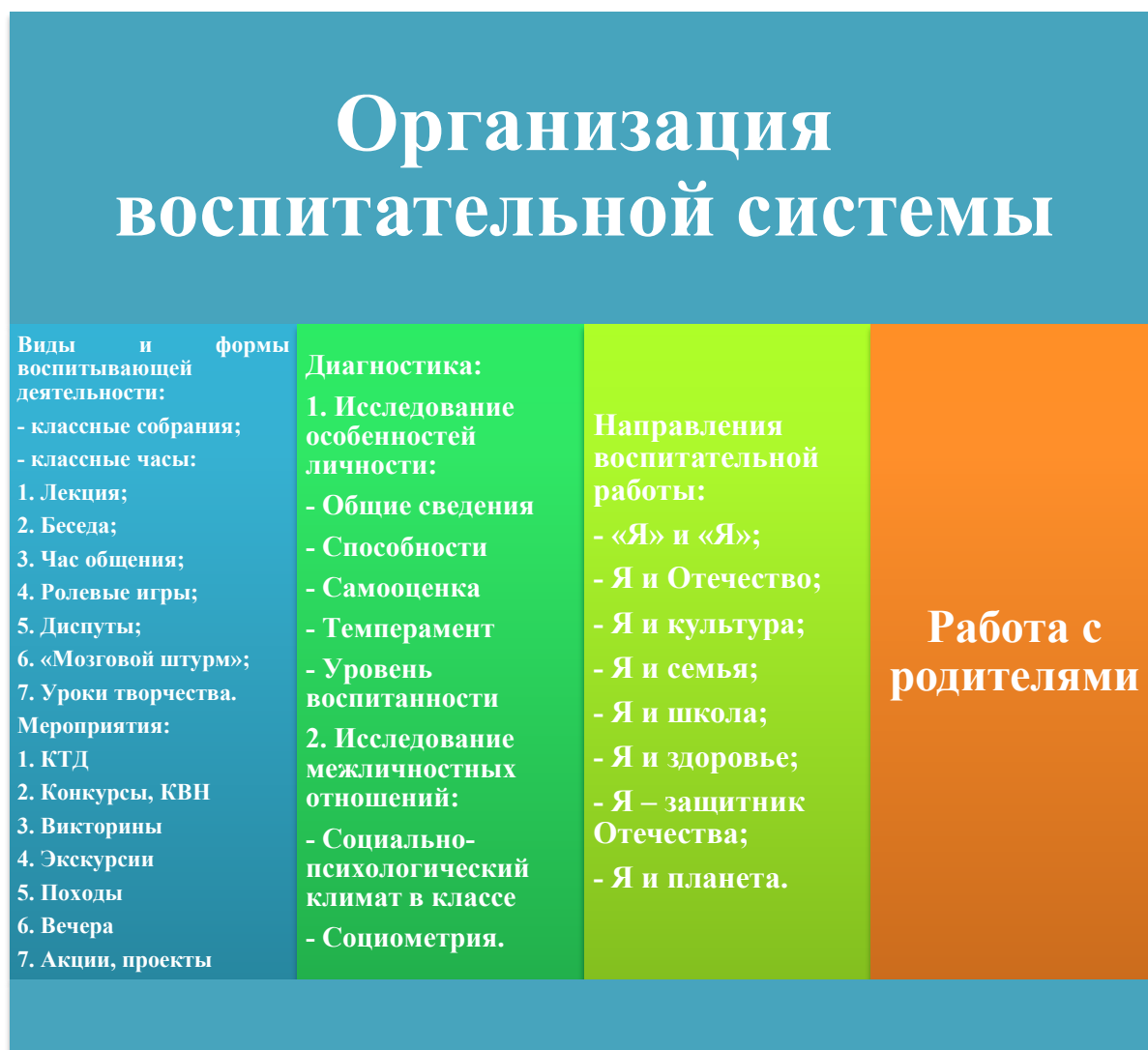
Рисунок 2. Организация воспитательной системы.

Важным условием духовно-нравственного развития и полноценного социального созревания является соблюдение равновесия между самоценностью детства и своевременной социализацией. Первое раскрывает для человека его внутренний идеальный мир, второе – внешний, реальный. Соединение внутреннего и внешнего миров происходит через осознание и усвоение ребёнком моральных норм, поддерживающих, с одной стороны, нравственное здоровье личности, с другой – бесконфликтное, конструктивное взаимодействие человека с другими людьми. Перечисленные принципы определяют концептуальную основу уклада школьной жизни.